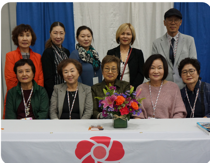
◀◀ BBKWA(미주 뷰티 여성 경영인 협회)