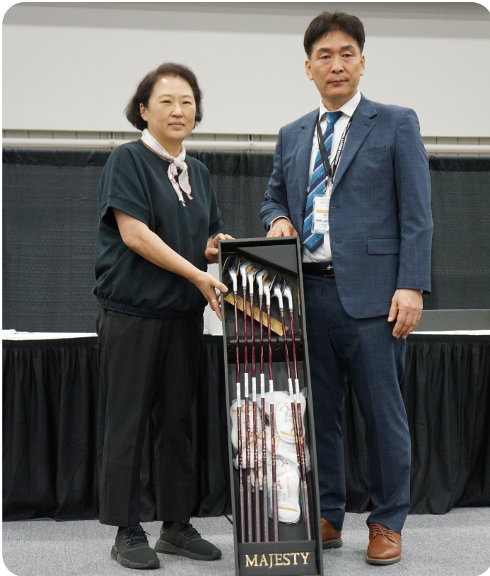
1등 혼마 4 스타 당첨(차혜윤 Golden Beauty, AL)